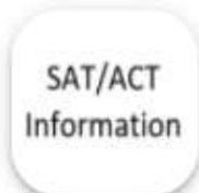
SAT & ACT Information Sheet